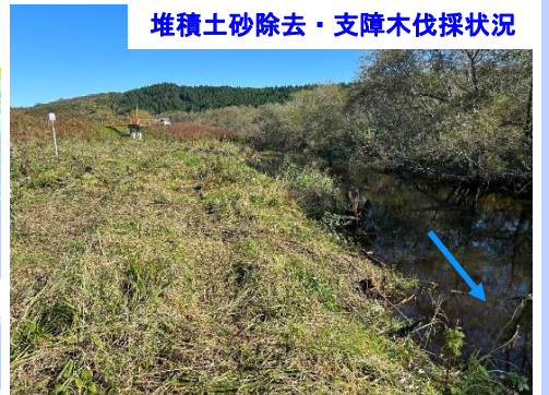
堆積土砂除去・支障木伐採状況