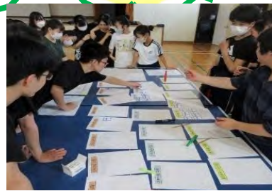
Doはぐ体験 (宗谷総合振興局)