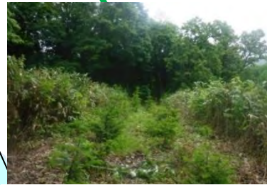
苗木の成長を妨げる雑草や灌木の除去 (宗谷森林管理署)