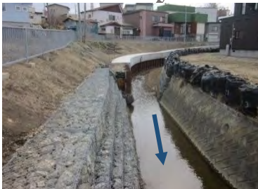
河道掘削・護岸整備 (宗谷総合振興局)