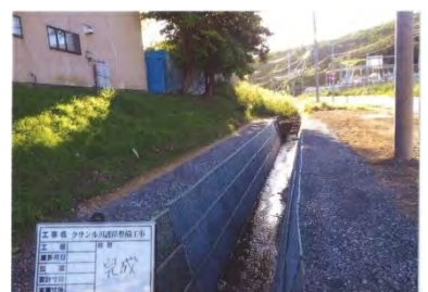
護岸整備(準用区間) (稚内市)