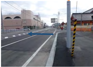
橋梁架替 (宗谷総合振興局)