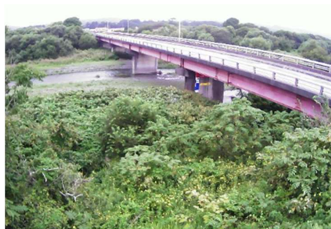
簡易型河川監視カメラによる映像提供（三石川）

水位計や簡易型河川監視カメラ等による河川情報の提供 （胆振総合振興局（室蘭建設管理部））