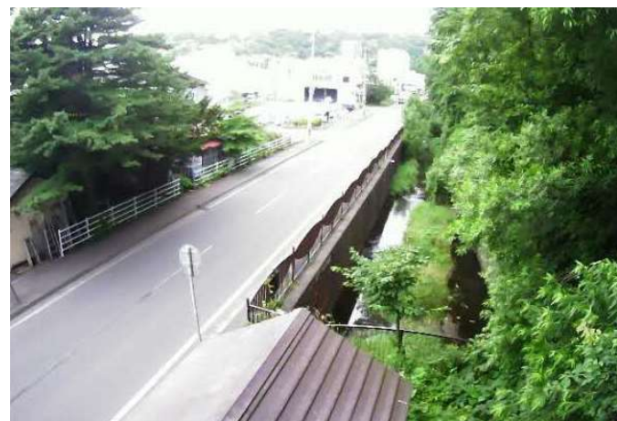
（知利別川）簡易型河川監視カメラによる映像提供