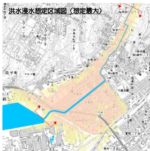
まちづくりでの活用を視野にした多段的な浸水リスク情報の検討 （胆振総合振興局）

想定最大規模や計画規模のみならず、より高頻度で発生する降雨規模での洪水氾濫区域を検討する