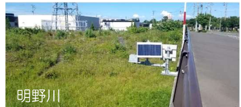
明野川 危機管理型水位計による観測データの提供（胆振総合振興局）