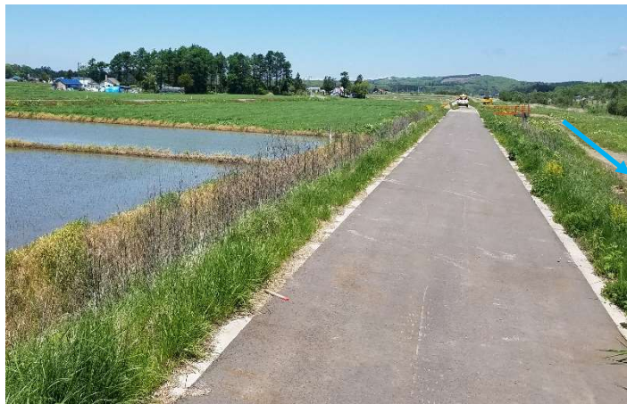
(安平川) 堤防天端舗装の実施

既存ダムにおける事前放流等の実施・体制構築 (室蘭開発建設部、胆振総合振興局、安平町、安平町土地改良区)