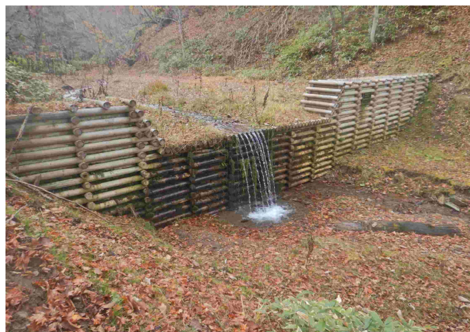
道有林内における治山ダムの整備