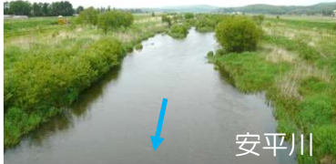
河道掘削等（胆振総合振興局）