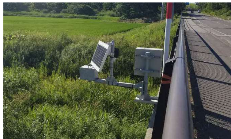
(ニタッポロ川) 危機管理型水位計による観測データの提供