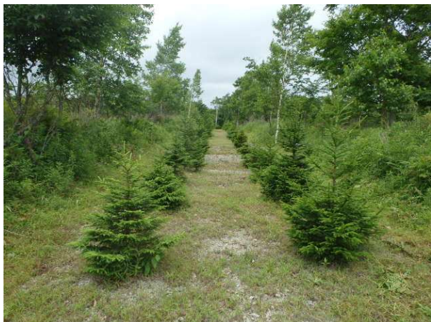
国有林内における植栽の実施 (胆振東部森林管理署)