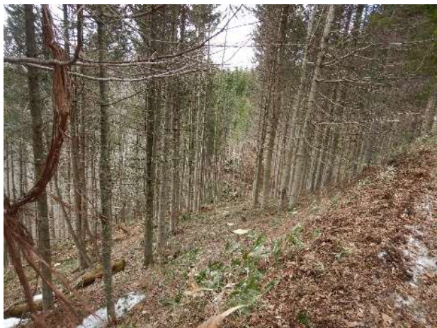
道有林内における間伐の実施 (胆振総合振興局)

まちづくり等での活用を視野にした多段的な浸水リスク情報の検討 (胆振総合振興局)