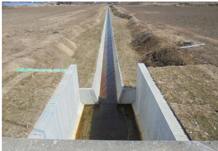
農業排水路の整備