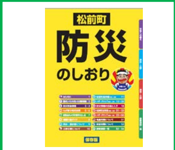
ハザードマップの作成・周知