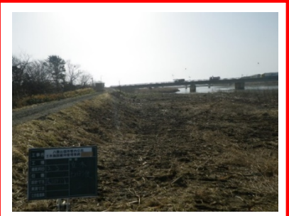
河道内樹木伐採イメージ