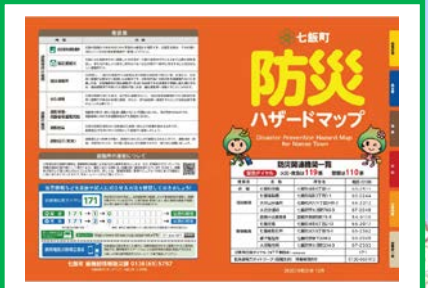
ハザードマップの作成・周知