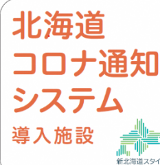
「北海道コロナ通知システム導入施設」のステッカーデザイン