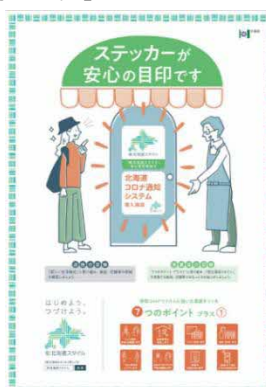
店頭掲示用ポスターデザイン