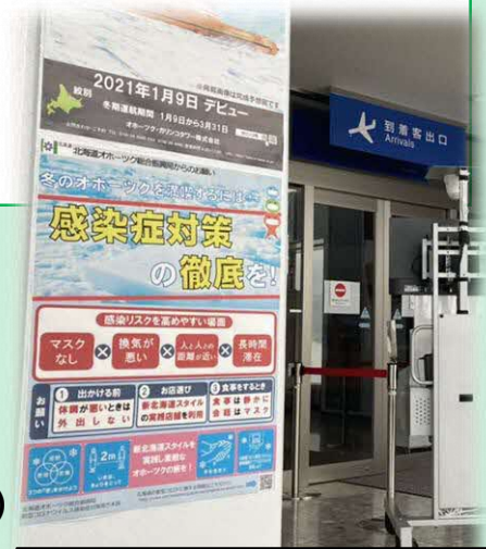
オホーツク紋別空港