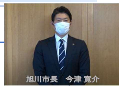
旭川市長メッセージ動画