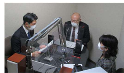
地域FM番組出演の様子