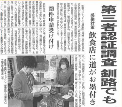
▲現地調査の取組の可視化