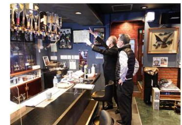
第三者認証の調査