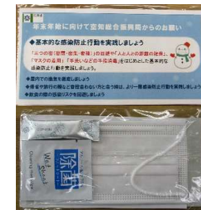
マスクとチラシのセット