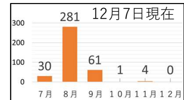
新規感染者数の推移