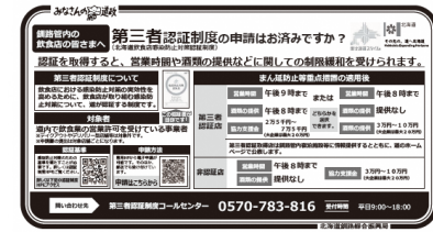
▲ 認証取得の新聞広告