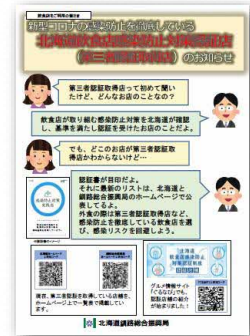
▲ 認証店利用の呼びかけ