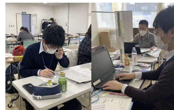
▲ 保健所応援風景（疫学調査の補助）