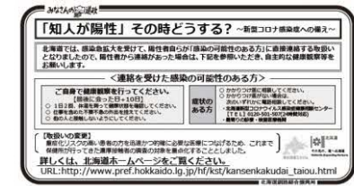
▲ 疫学調査重点化の新聞広告