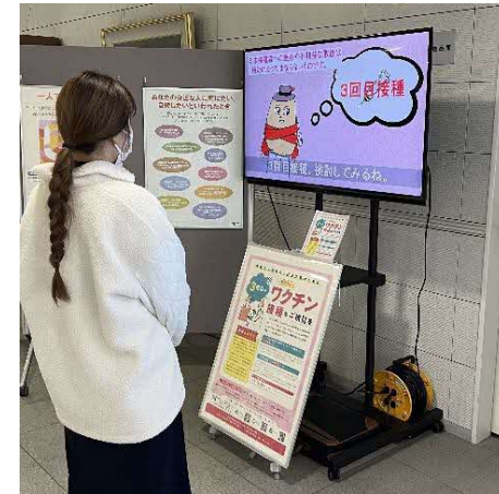
▲広域センタービルロビーで ワクチン広報動画を放映