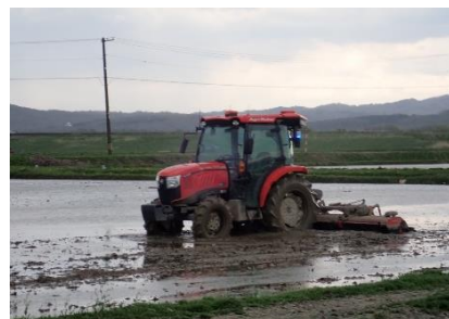
自動操舵トラクター