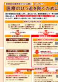
▲啓発ポスター (新たな対応フロー)