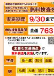
▲啓発ポスター (無料検査)