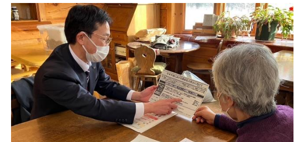
主要宿泊施設への年末年始の注意喚起