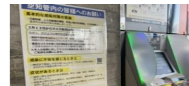
【感染対策の周知(岩見沢駅)】