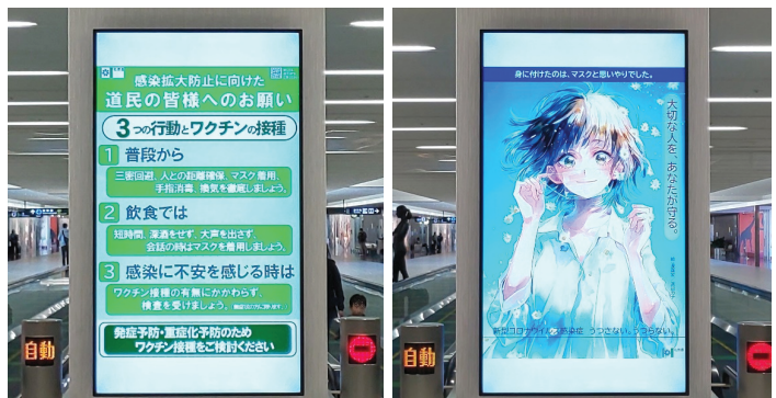
<新千歳空港サイネージ>

・道の対策に併せて啓発ポスターを作成、駅・空港・応援団企業等へ 配布(計9回、515箇所)