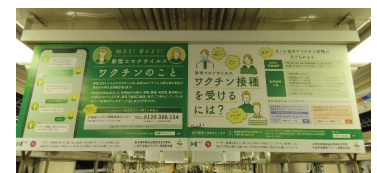
<地下鉄車両のワクチンチラシ広告>