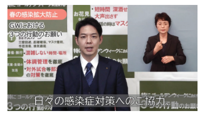
<知事メッセージ動画の配信>