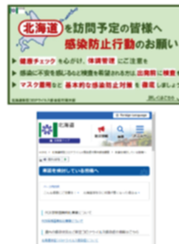
<道外の方へSNSによる発信(GW期間中)>