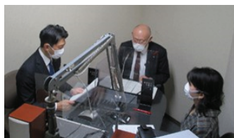
<地域FM番組による啓発>