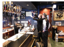
<第三者認証の共同調査>