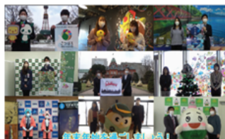
<リレーメッセージ動画制作>