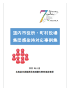
<事例集の共同作成>