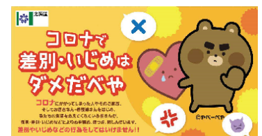
<差別・偏見に関するインターネット広告バナーの掲出>