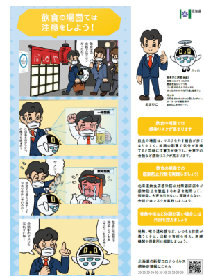
<4コマ漫画による啓発チラシの掲載>