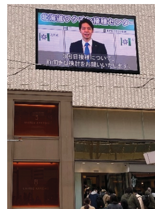
<街頭大型ビジョンの活用>