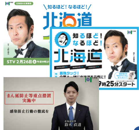
<広報番組内で知事メッセージ放映>