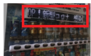
<自動販売機の活用>