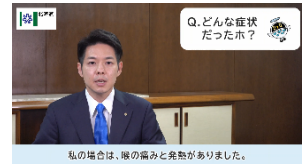
<知事の感染体験動画配信>