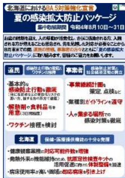
<夏の感染拡大防止のお願い>