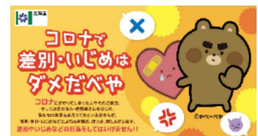
<差別・偏見に関するインターネット広告バナーの掲出>