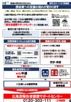
<陽性者健康サポートセンターの利用案内>