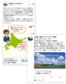
<SNSによるターゲティング広告>