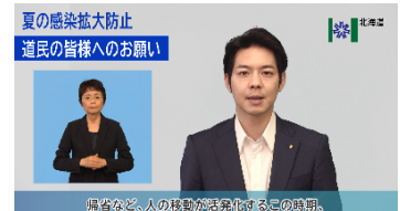
<知事メッセージ動画の配信>