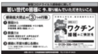
<若い世代向け新聞広告>