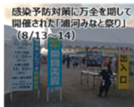
<夏祭りでの感染予防対策>