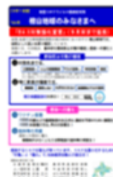
<町との住民向け共同メッセージ>