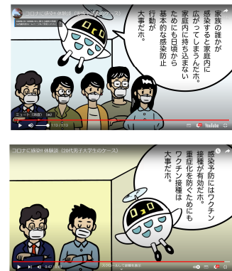
<アニメによる感染体験談の掲載>