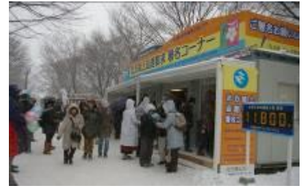
さっぽろ雪まつり会場での署名活動

また、1965年から始められた「北方領土返還要求署名」については、全国各地の関係団体などが積極的に署名活動に取り組んでおり、 2024年3月末時点での総署名数は9,407万人 を超えています。