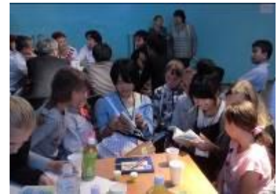
北方四島への訪問 (国後島での青少年住民交流)

北方領土問題が解決されるまでの間、相互理解の増進を図り、領土問題の解決に寄与することを目的として行われている旅券・査証なしによる日本国民と北方四島在住ロシア人との相互訪問事業で、1992年から事業実施団体が実施しています。