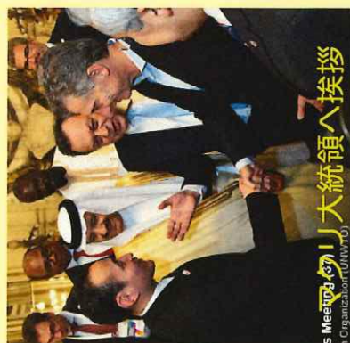
メネム大統領へ挨拶