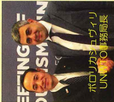
ポロリカシユヴィリ UNWTO事務局長