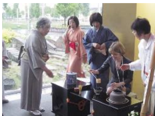
会合会場でのリフレッシュイベント （APEC貿易担当大臣会合）