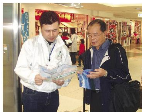
札幌駅でのインフォメーションセンター設置と通訳ボランティアガイド（APEC貿易担当大臣会合）