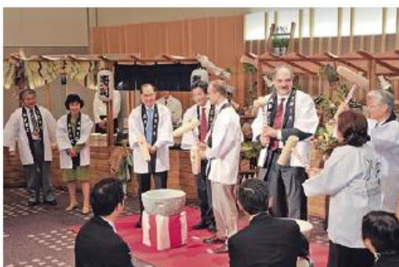
道産食の発信イベント（APEC貿易担当大臣会合）