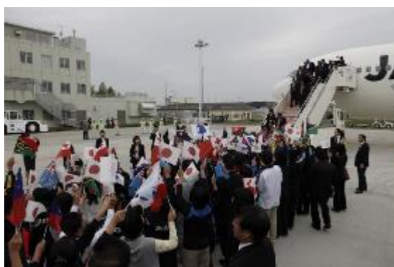
空港歓迎行事（太平洋島サミット）