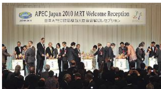
地元主催歓迎レセプション（APEC貿易担当大臣会合）