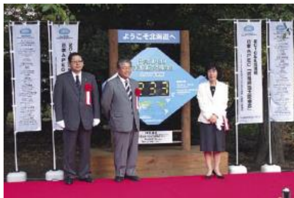
カウントダウンモニュメントの設置 （APEC貿易担当大臣会合）