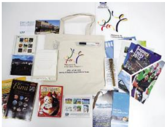
政府関係者・報道機関に産業・観光・文化情報を発信する ウェルカムパッケージ（APEC貿易担当大臣会合）