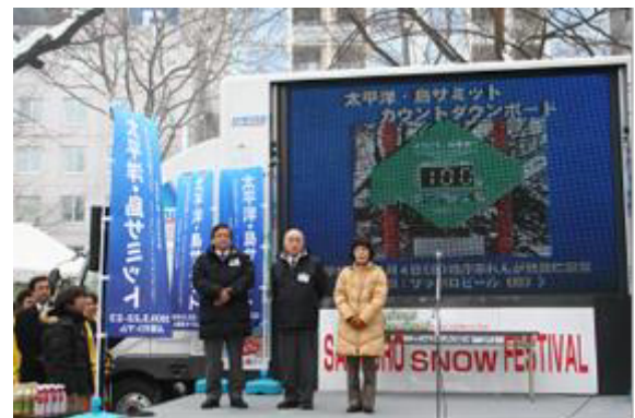
さっぽろ雪祭りでの100日前イベント （太平洋島サミット）