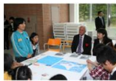
各国首脳と地域との交流事業（太平洋島サミット）