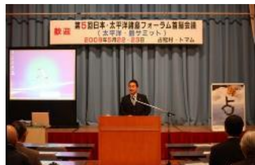
町民の受入れ気運の醸成を図る「太平洋・島サミットフォーラム in 占冠」（太平洋島サミット）