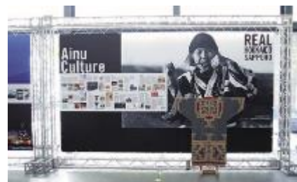
情報発信ブースの設置（APEC貿易担当大臣会合）