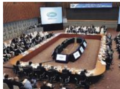
会合の様子（APEC貿易担当大臣会合）

北海道倶知安町で開催されるG 2 0 観光大臣会合の成功に向け、官民一体となったオール北海道としての受入体制を確立し、支援・協力を行うとともに、大臣会合の機会を捉えて北海道の魅力を国内外に広くアピールする。