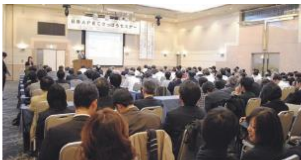
会合開催の周知と理解促進に向けて「2010 APEC さっぽろセミナー」を開催（APEC貿易担当大臣会合）