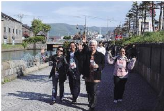
エクスクーション（APEC貿易担当大臣会合）