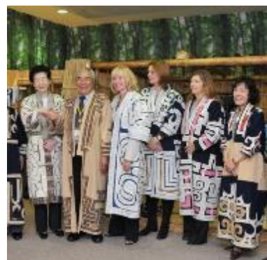
配偶者プログラムでのアイヌ文化体験 （北海道洞爺湖サミット）