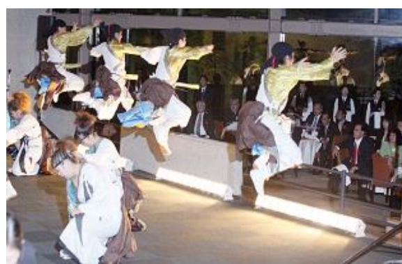
政府主催歓迎レセプションでのYOSAKOIソーラン披露 （太平洋島サミット）