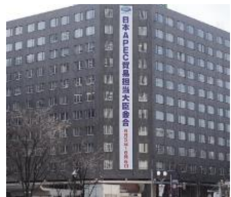
ポスター掲示（左：APEC貿易担当大臣会合 右：太平洋島サミット） 懸垂幕（APEC貿易担当大臣会合）