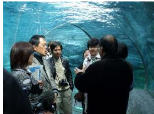
プレスツアー（北海道洞爺湖サミット）