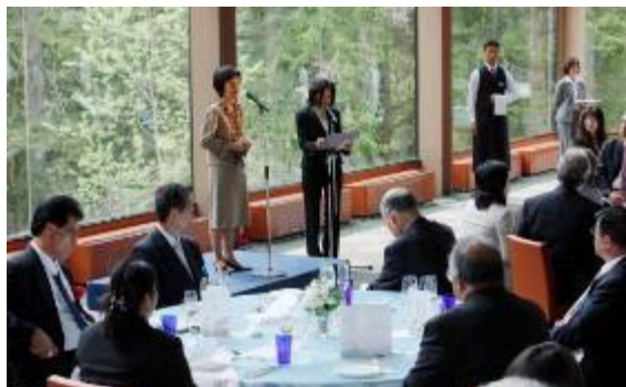
地元主催昼食会（太平洋島サミット）

地域主催歓迎レセプションの開催、リフレッシュイベントの開催 各国VIP向け記念品贈呈 など