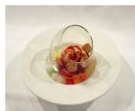
道産食材を活用した料理を提供