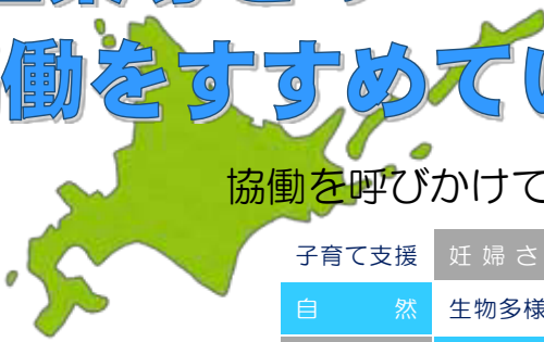
協働を呼びかけている政策分野