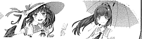
環境省COOL CHOICE MOE 萌えキャラクター 君野イマ 君野ミライ