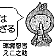
環境忍者 えこ之助