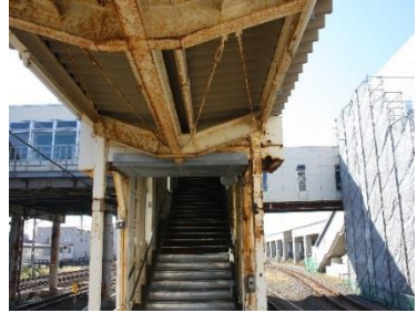
木古内駅ホーム上屋 (屋根、柱)