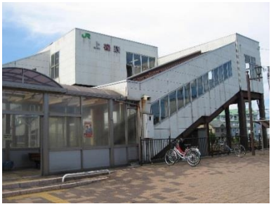
上磯駅 (外壁、屋根、防水)