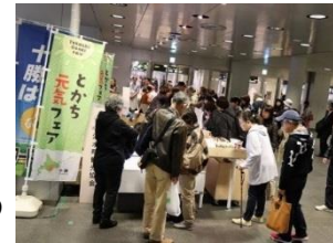
とかち元気フェア