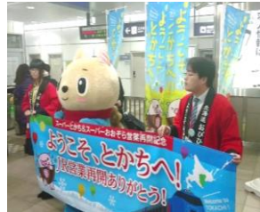
十勝晴れ観光PRキャンペーン