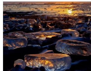
ジュエリーアイス(豊頃町)