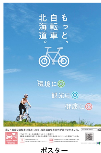
広報ツールイメージ