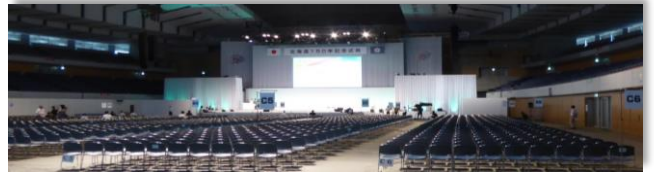
式典会場のイメージ