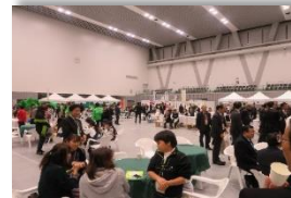
おもてなし広場 (先催県：H30 東京都)