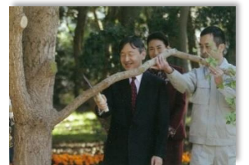
お手入れ(枝打ち) (先催県：H30 東京都)