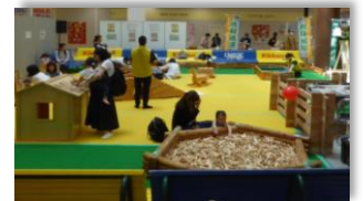
木育コーナーのイメージ