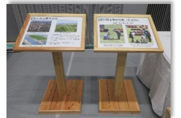
説明用パネル (先催県：H30 東京都)