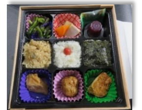
配布弁当イメージ (先催県：H30 東京都)