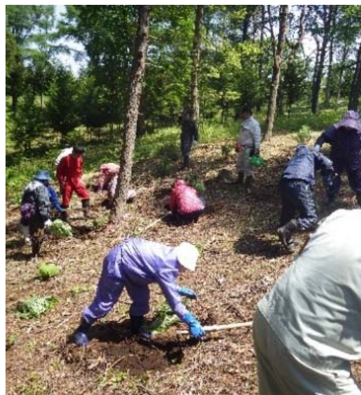
JFひやま漁協女性部江差支部