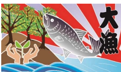
北海道お魚殖やす植樹運動を応援しています