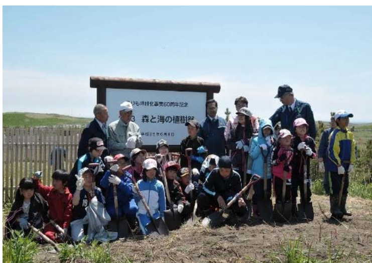
えりも漁協女性部