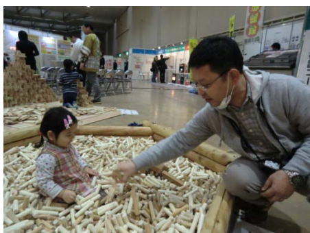
▲きぼう(木棒)のプールでパパと一緒に