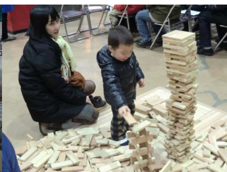
▲どこまで高く積めるかな？