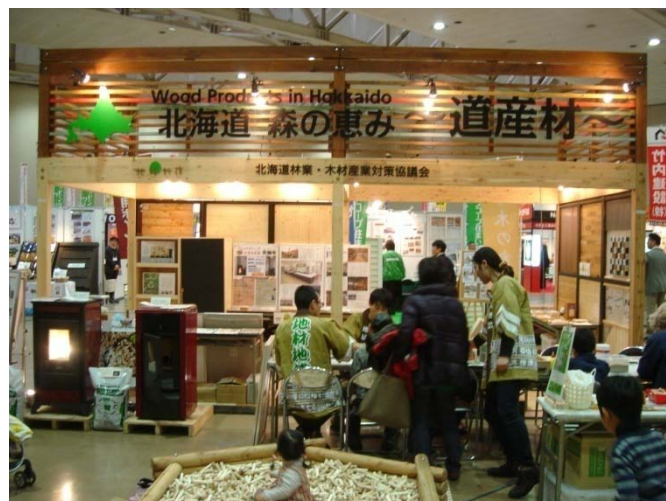
▲地材地消ブースは地域材を使用して建てました。手前左には木質ペレットストーブも展示しています。

イベントでは、地域材を使ったブースを建て、その中に道産材を使った家具等を設置し、地材地消をPRしたほか、木質ペレットストーブの展示や、北海道の木のおもちゃを集めた「木育ひろば」、北海道の木を使った「ウッドシェイカーづくり」などの木工体験を行いました。