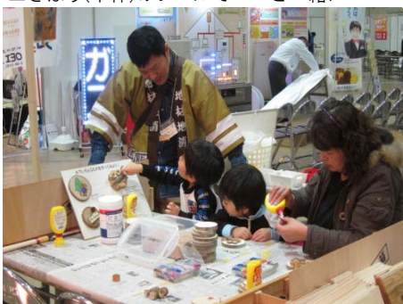
▲木エクラフト体験