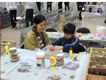
▲何を作っているのかな？