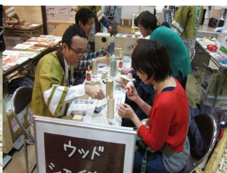
▲ウッドシェイカーづくりは大好評！