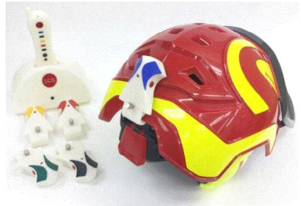
親機1、子機5（子機1つはヘルメットに装着）

作業員同士が一定の距離を保ちつつ作業する林業現場では、周囲に声が届きにくく、怪我をしても遠隔の作業員が気がつかず、早期発見されにくい状況にありますが、そのような環境の改善に期待できそうです。