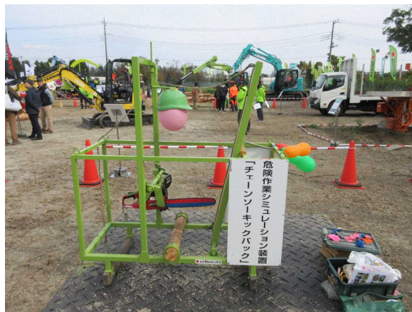
キックバック体験装置