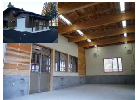
センター外観と内装

そこで、鳥取県では、効率的で安全な林業を実践しているオーストリアをモデルとし、平成26年度から調査団の派遣や技術導入に向けた取組を実施してきました。その技術導入の一環として、オーストリアの森林研修所を参考とした、伐倒等を徹底して反復訓練・教育できる「とっとり林業技術訓練センター（愛称：Gut Holz）」を全国に先駆けて平成29年3月に開設しました。