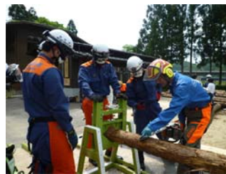
風倒木伐採訓練装置