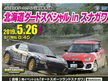
（北海道ダートスペシャル in スナガワ大会）

5月25日（土）から26日（日）に開催された「JAF全日本ダートトライアル選手権第4戦」において、大会運営の際に競技車両や運営車両などにより排出されるCO 2 をオフセットするため石狩市及び道有林のオフセット・クレジット（J-VER）を活用していただきました。