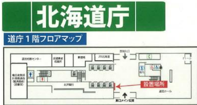
● 広告付庁舎等案内板（広告・地図・インデックス部分）