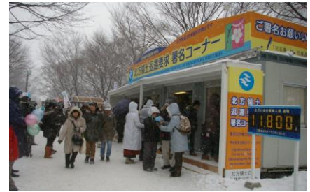
さっぽろ雪まつり会場での署名活動

また、1965年から始められた「北方領土返還要求署名」については、全国各地の関係団体などが積極的に署名活動に取り組んでおり、2019年3月時点での総署名数は9,000万人を越えています。