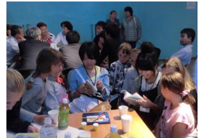
北方四島への訪問 (国後島での青少年住民交流)

北方領土問題が解決されるまでの間、相互理解の増進を図り、領土問題の解決に寄与することを目的として行われている旅券・査証なしによる日本国民と北方四島在住ロシア人との相互訪問事業で、1992年から事業実施団体が実施しています。