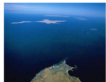
納沙布岬上空から見た歯舞群島

北方四島は、北海道本島の北東方に隣接して位置しており、一番近い歯舞群島の貝殻島は根室の納沙布岬から3.7kmしか離れていません。四島を合わせた総面積は約5,003km 2 で千葉県(5,157km 2 )や愛知県(5,172km 2 )の面積に相当します。