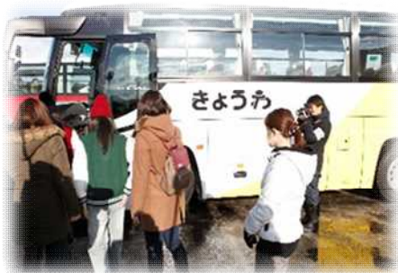
住民避難訓練 (バスによる避難)

※ 2 月 5 日（月）に、防災関係機関によるオフサイトセンター運営訓練などを実施します。