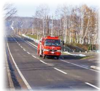
広報訓練 (広報車による広報)