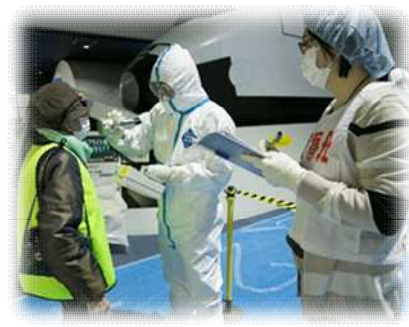
原子力災害医療活動訓練 (避難退域時検査)