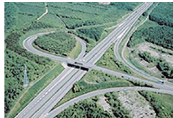
苫小牧東インターチェンジ