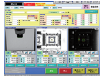
自社開発画像アプリケーションソフト