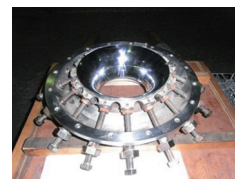
射出成型機アウトダイの製作