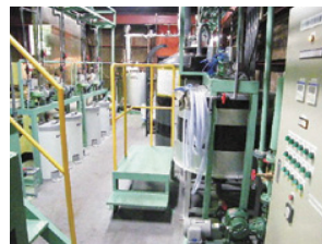
完全クローズド排水処理システム