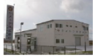
北海道営業所外観