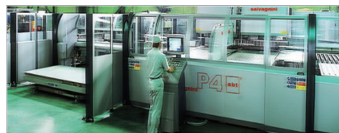
パネルベンダーシステム