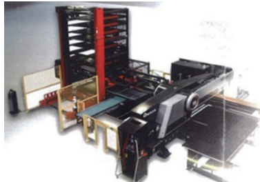
レーザ・パンチ複合加工機