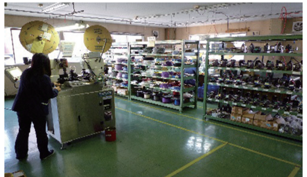
電子部品組立現場の様子

1本からの小ロット～1000本などの大量ロットにも対応可能で、さらにUL認定工場として、ULワイヤリングハーネスプログラムでの出荷も可能です。