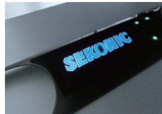
セグメントEL+静電スイッチ