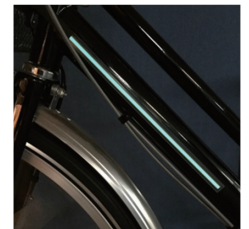
自転車フレーム 夜間点灯用EL