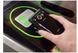
suicaカードリーダーバックライト用EL