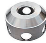
遠心分離機用部品

鑄造法を活かした複雑立体形状の造形を得意としており、製造能力約1t/個以下の製品を特殊鑄鋼にて製造しています。豊富な経験から、耐摩耗性の向上や高温腐食環境にも対応する材質の選定や、形状提案なども行います。3種類の砂型造型法：有機自硬性（フラン、アルカリフェノール）、シエルモールドによって、特徴を活かした造型を行っています。