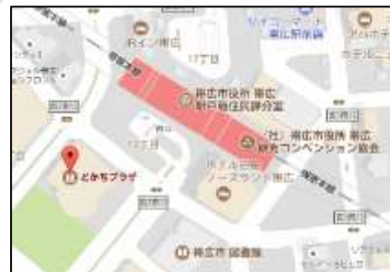
とかちプラザ 帯広市西 4 条南 13 丁目 1 番地